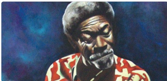
Illustration © Jean-Claude Legros

Dans le cadre du festival Meaux Blues, venez découvrir l'exposition de peinture de Jean-Claude Legros, qui se tiendra du 7 au 24 novembre. Plongez dans l'univers vibrant de l'artiste, où chaque toile évoque l'essence du blues à travers des couleurs riches et des émotions profondes. Découvrez des œuvres uniques et intemporelles qui capturent l'esprit du blues.